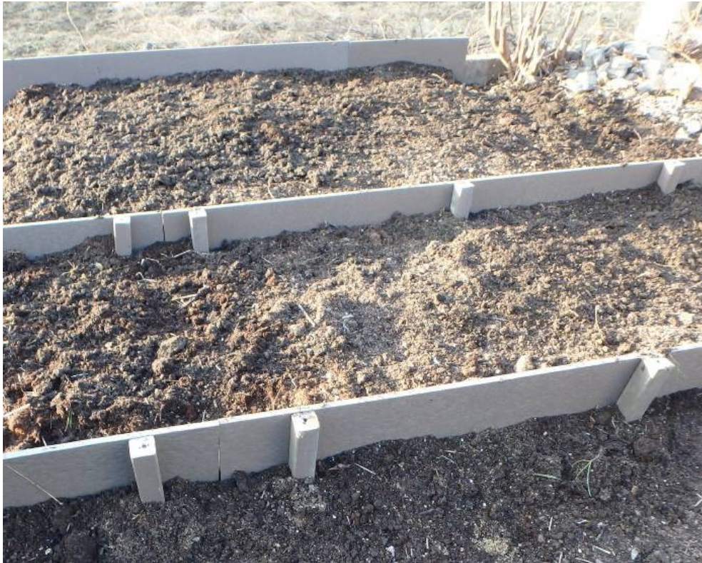
緩斜面の土壌流出防止のためのリフラー土留め