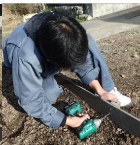
ボードと杭をビス止め