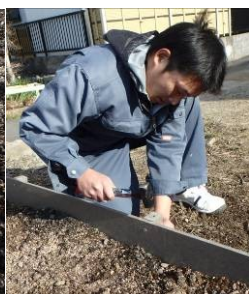
リフレ杭打ち込み