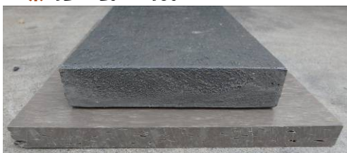
上から 12mm、18mm 色は黒と茶の2色