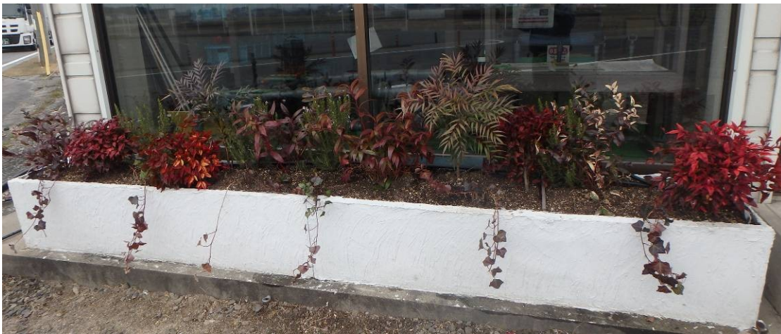
リブラ f 花壇枠 43cmx180cmx2 基接続