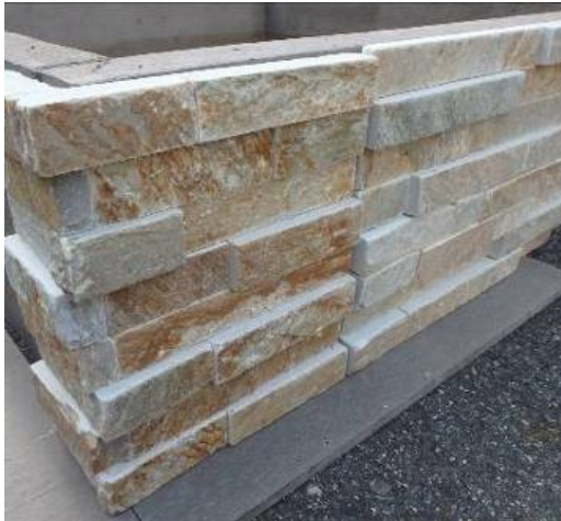
既製品ストーン壁