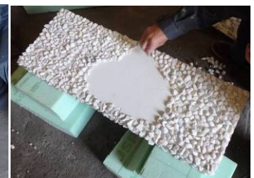
中ジャリ石は貼り付ける コテで仕上げし、一日放置する