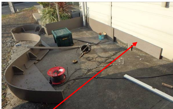
建物の保護材として利用