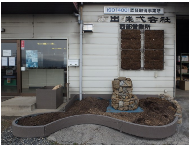
曲面リブラ枠に 擬岩貼り付け