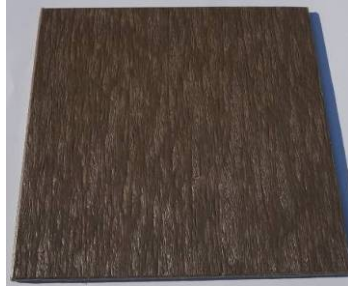
12mm ボード 茶