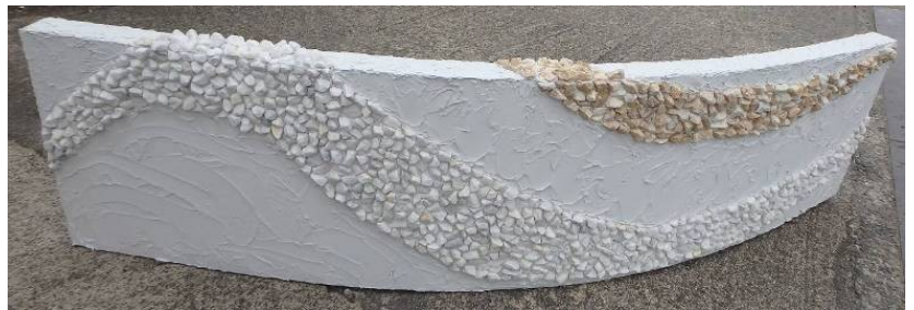
リブラ f 花壇曲面枠 43cmx180cm