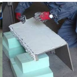
リフラ板にポンドを塗る