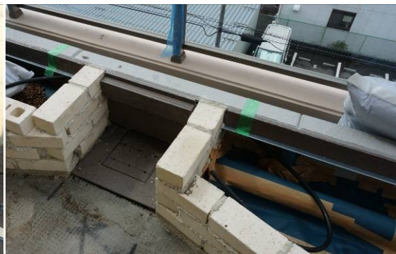
屋上庭の当て板として利用